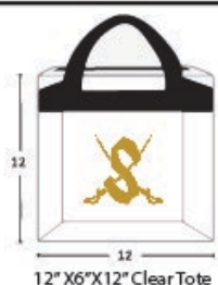
12" X6"X12" Clear Tote